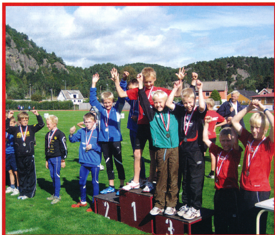
Premieutdeling under Søgnelekene i 2009