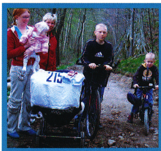
Alle kan delta i Tjomsevannet rundt