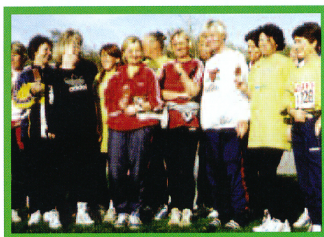
Damelag fra Søgne under Holmenkollstafetten