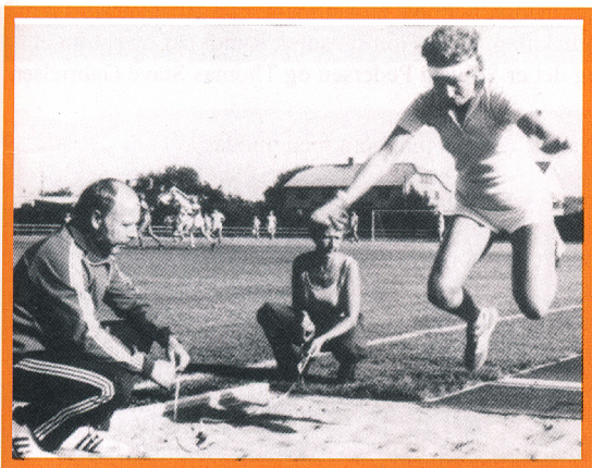
Idrettsmerkeprøve på idrettsplassen i 1980-årene