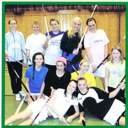
Jenter 15 på innebandytrening i gymsalen på Søgne videregående skole.