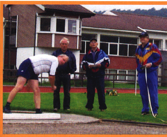
Idrettsmerkeprøve på Søgne stadion i 2009