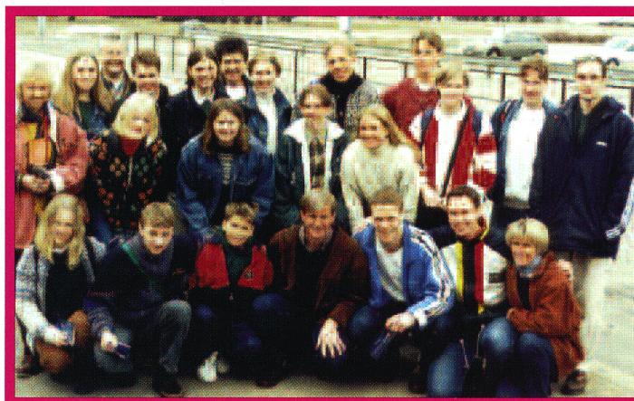
Treningsleir i Portugal for ca. 10 år siden