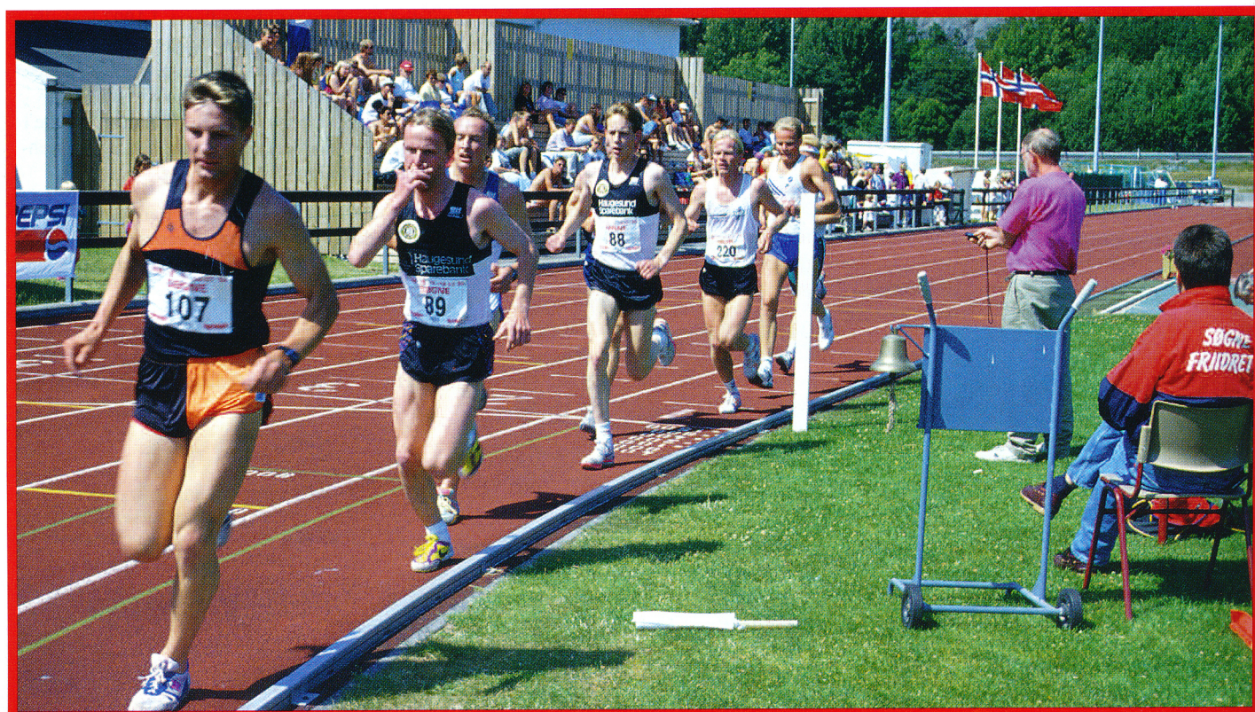
Nasjonalt stevne på Søgne stadion på 1980-tallet.